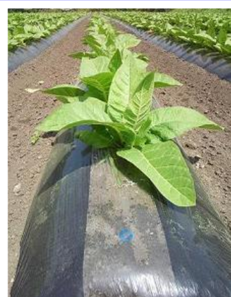
配色 黒マルチ マーク付

中央部が透明、両端がシルバーのマルチです。 シルバー部はアブラムシ等の忌避効果があると言われています。 又、シルバー部は光反射率が高く、熱を吸収しにくい為、暑い日 でも伸びが少なく、マルチの剥ぎ取りがしやすいです。