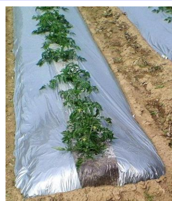
配色 シルバーマルチ